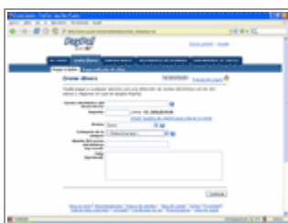
Pantalla Enviar dinero

En este apartado revisaremos cómo enviar dinero mediante nuestra cuenta Paypal. Lo único que necesitamos conocer es la dirección de correo electrónico del destinatario (así como la cantidad que enviaremos, evidentemente). La pantalla de Pagos se encuentra disponible en el Menú Principal de la parte superior, bajo el nombre de Enviar Dinero . Nos encontramos algo similar a esto: