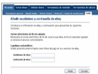
Datos de la cuenta Ebay

Para que Paypal sepa cuáles son los artículos que tenemos pendientes de pago en Ebay es necesario proporcionarle la información de nuestra cuenta Ebay. Eso se puede hacer pulsando en el botón Añadir , donde nos pedirá nuestro pseudónimo y contraseña de Ebay: