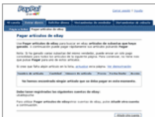
Pagar artículos Ebay

En el caso concreto de que los artículos que queramos pagar sean de Ebay (notar que Paypal y Ebay están muy relacionados e interaccionan juntos a la perfección), podemos hacerlo de un modo mucho más sencillo utilizando la opción Pagar Artículos de Ebay en el Menú Enviar Dinero :