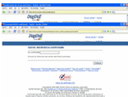
Confirmación registro completo

Sabremos que hemos terminado el registro cuando veamos esta pantalla: