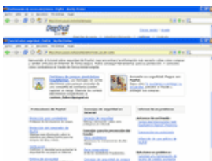
Centro de Seguridad Paypal

Eso son simplemente unos pocos consejos para tener en cuenta desde el primer día, pero también conviene tener presente el Centro de Seguridad de Paypal , disponible aquí y que tiene la siguiente pinta: