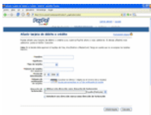
Datos de nuestra

Paypal nos ofrece la posibilidad de incluir la información sobre la primera tarjeta de crédito directamente después de haber creado la cuenta. Aparece una pantalla como esta: