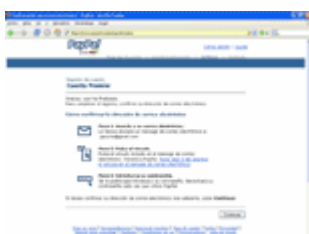
Verificación del email

Para finalizar el registro, simplemente debemos demostrar que somos propietarios de la dirección de correo que hemos facilitado en el proceso. Es una operación muy simple, como se puede ver aquí: