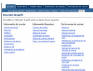
Opciones de la cuenta Paypal

Señalar simplemente que si por cualquier motivo pensamos no utilizar nunca más nuestra cuenta, es importante cerrarla definitivamente. Así nadie (ni nosotros) podremos entrar nunca más en ella, y nos evitamos cualquier tipo de problema futuro. Esto se puede hacer desde la opción Cerrar Cuenta .